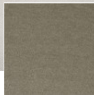
220 / Pleasure / Rehbraun